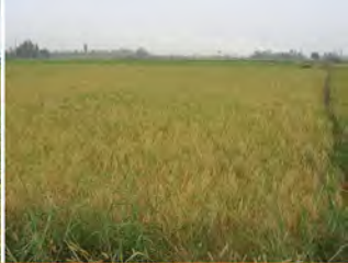
استفاده از سوپر استم ۳ سی و عدم ورس