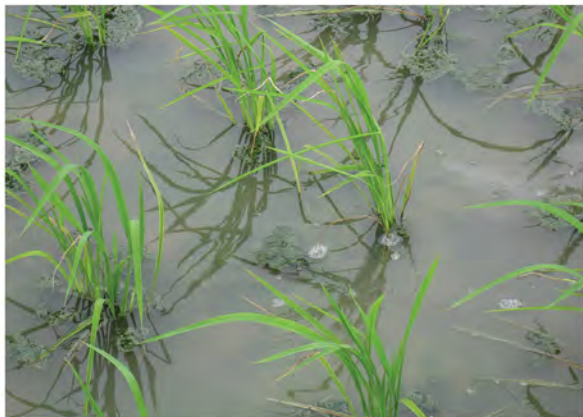
مرحله رشدی مناسب برای کار برد سوپر استم ۳ سی