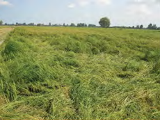
عدم استفاده از سوپر استم و ورس